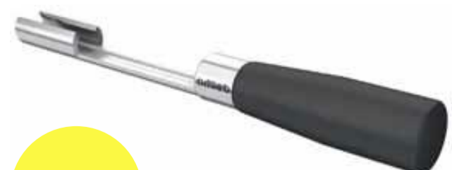
Artikelnummer WGM 48-05

The mounting fixture MoFix facilitates a lot the mounting of the tool gripper specially when the spindle position is vertical. The MoFix WGM is screwed on the thread of the pull bar after having mounted the reset spring. Then the single clamping segments can be inserted in the spindle. The MoFix is not only simplifying the mounting but it is also drastically shortening the mounting time.